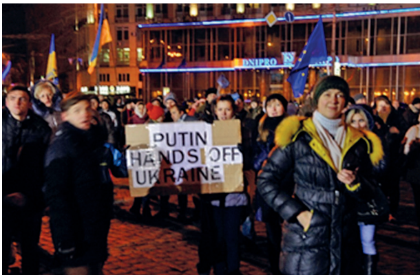
Іл. 1. Протестувальники на Євромайдані 26.11.2013 р.

спрямування, які фігурували під час листопадових протестів, такі гасла, як «Putin, Hands off Ukraine» (іл. 1), були поодинокими.